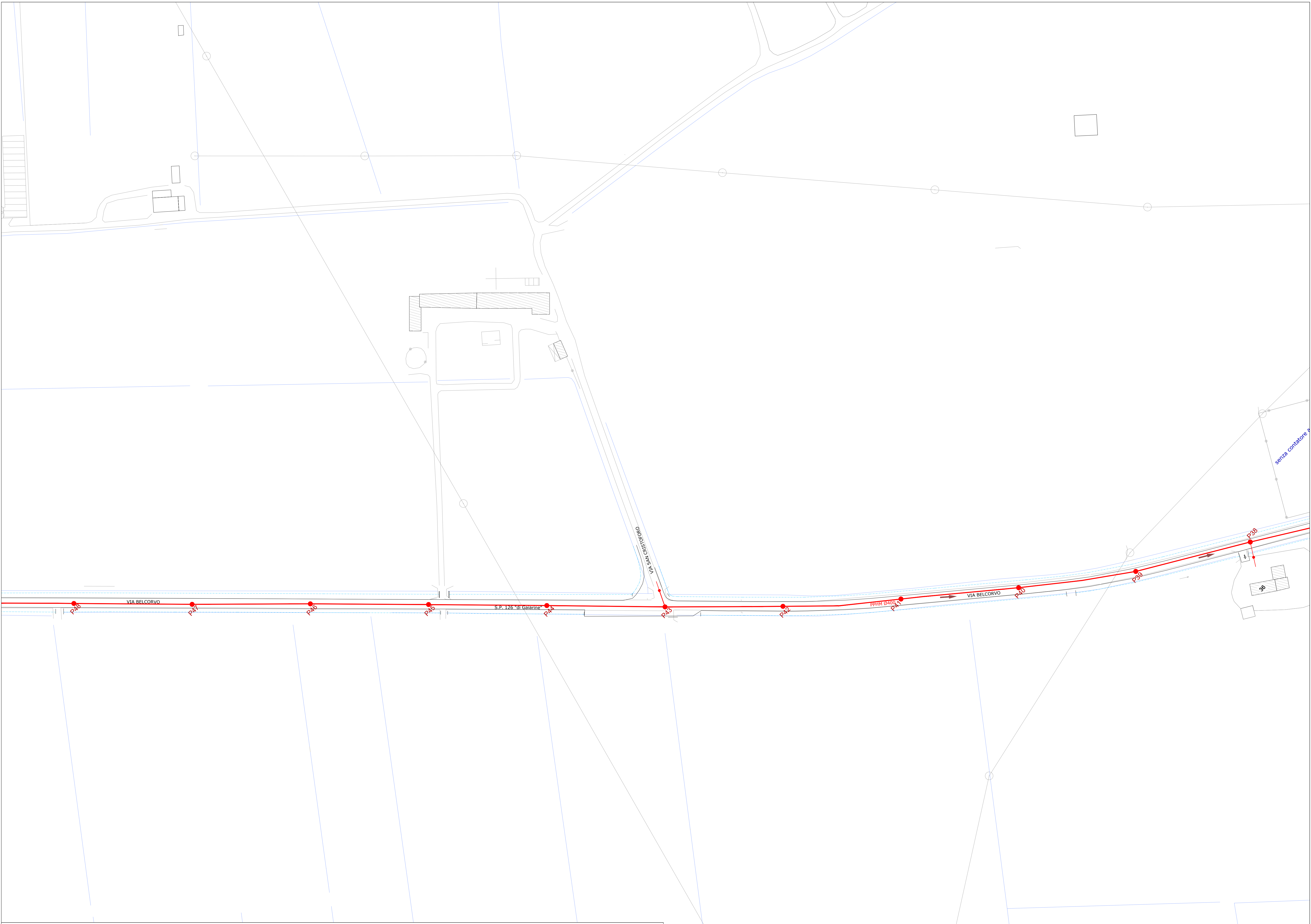
QUADRO DI UNIONE